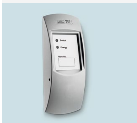
TSE 6201 CONTROL